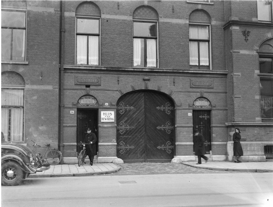
Het Huis van Bewaring aan het Kleine- Gartmanplantsoen In Amsterdam; bekender als Weteringschans (foto Beeldbank stadsarchief Amsterdam)