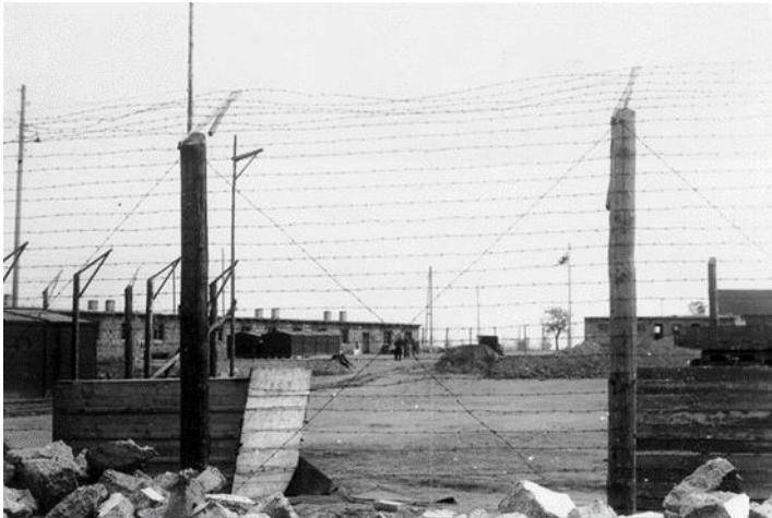
Beeld van arbeidsopvoedingskamp Zöschen