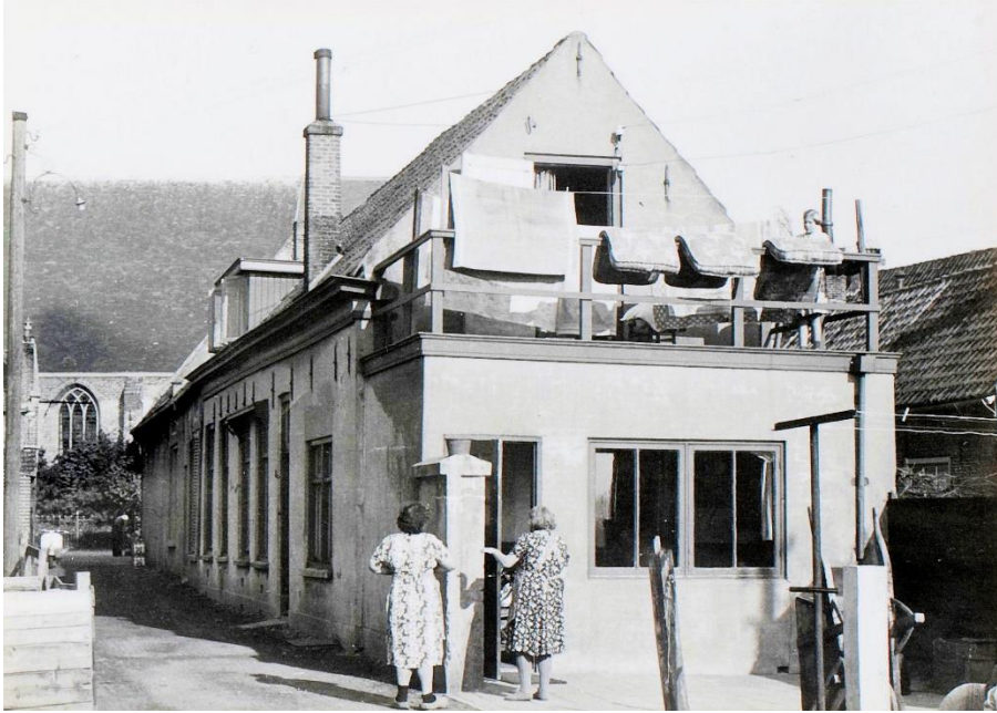
Het Kloosterslop gefotografeerd vanaf de zuidzijde richting de Dom. Hoofdstraat 18 moet iets links van dit slop hebben gestaan.