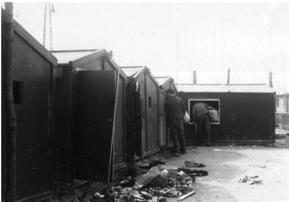
Foto van mannen in kamp Zöschen. Zo te zien op de plaats waar kleding werd verzameld. In het kamp werd gestreepte kleding gedragen

De familie Wapenaar deed in Trouw van 25 juni 1945 een oproep om inlichtingen over het lot van Tjerk. Omstreeks dezelfde datum verscheen al het overlijdensbericht. Verzoeken om inlichtingen als hierboven verschenen de eerste jaren na de oorlog nog geregeld in de kranten.