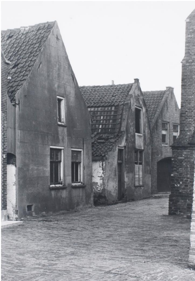
De Kerkstraat, met rechts een deel van de Domtoren en de kerk. Het huis links is nummer 15.