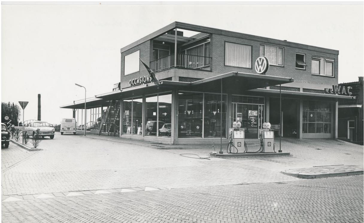
WAC garage aan de Hoofdstraat met de brugoprit naar boerderij Blijvenburg.