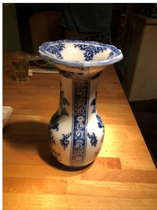
De vaas die het kaststel compleet

Het is de bedoeling dat de twee vazen binnenkort een vaste plek op de kast in de woonkamer terug krijgen en met extra spots worden aangelicht.