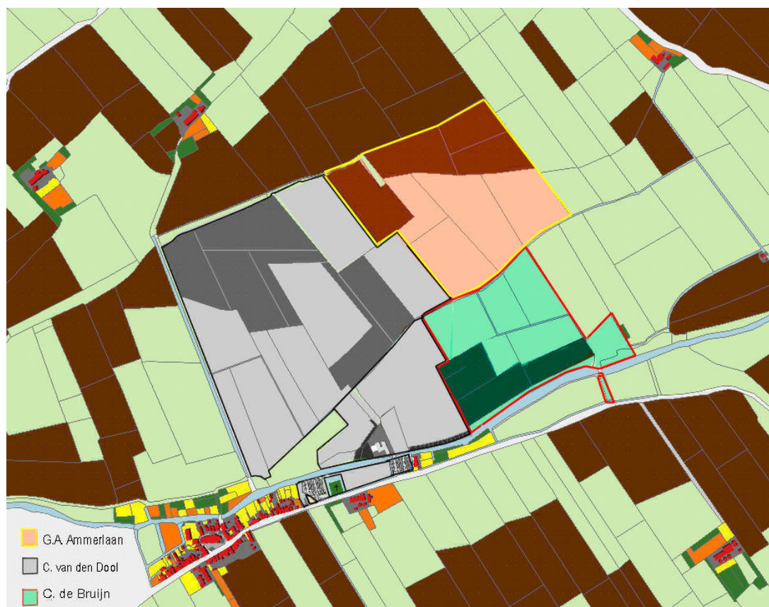
Kaartje met in grijs de percelen in eigendom van Cornelis van den Dool in 1832.

Grote delen van de Lierpolder behoorden aan het begin van de 19 e eeuw bij boerderij Blijvenburg. Totaal ruim 36 ha bouw- en weiland. Deze boerderij was vanaf de Hoofdstraat bereikbaar via een eigen brug over de Lee die later in de volksmond de 'WAC-brug' genoemd werd. In 1832 was Cornelis van den Dool de eigenaar. Op onderstaand kaartje van HisGIS zijn alle percelen die op naam van Cornelis van den Dool stonden, met een grijs tint aangegeven. Het is een enorme aaneengesloten lap grond die zich uitstrekt vanaf de Kerklaan in het westen, de Lee in het zuiden tot aan de huidige Veilingweg in het noorden. Aan de noordoostzijde grensden zijn percelen aan die van Van Rijn/ Ammerlaan (rose) en daaronder waren de percelen met een oppervlakte van ruim 9 ha eigendom van Cornelis de Bruijn uit Maasland (groen). De Bruijn was tevens eigenaar van de brug die hem vanaf de Lierweg toegang gaf tot zijn percelen. Nu wordt die brug in de volksmond de Laan van Adrichembrug genoemd. Op het land van deze drie grondeigenaren woont nu het grootste deel van de Lierse bevolking. De komende 15 jaar moeten daar nog vele honderden nieuwbouwwoningen bijkomen.